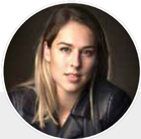
Giulia Steingruber Studentin HFSZ, Schweizer Turnerin und Olympiamedaillengewinnerin