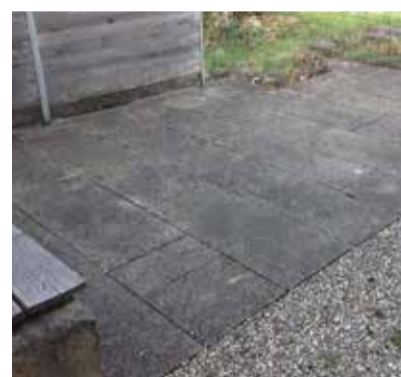
Sandsteinplatz mit Flechtenbefall.