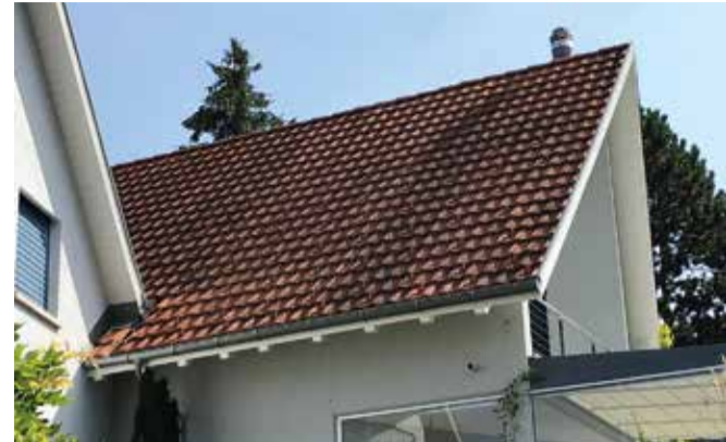
Tonziegeldach mit Algenbefall und Moos.