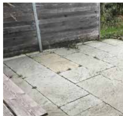
Sandsteinplatz nach einem Jahr.