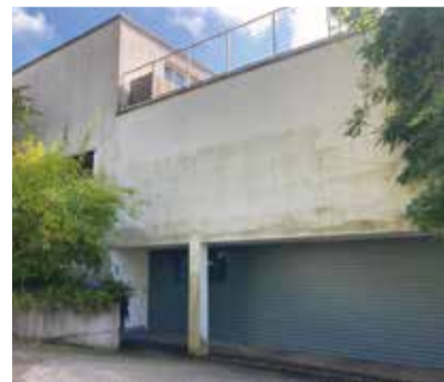
Putzfassade mit Grünalgenbefall.