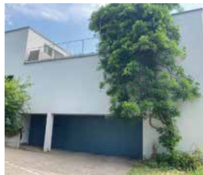
Fassade circa ein Jahr später.