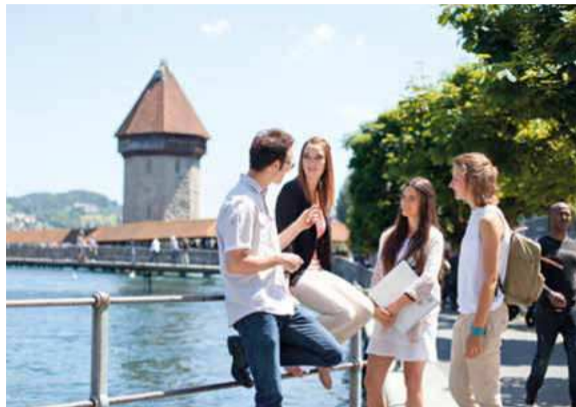
Studieren Sie in Luzern: Die Ausbildungsräumlichkeiten der PH Luzern befinden sich mitten in der Stadt.

Würden Sie gerne unterrichten, haben aber keine gymnasiale Matura? Die PH Luzern bietet für Quereinsteigende ein spezielles Aufnahmeverfahren an. Wenn Sie über 30 Jahre alt sind, einen Lehrabschluss und Berufserfahrung vorweisen können, dür-