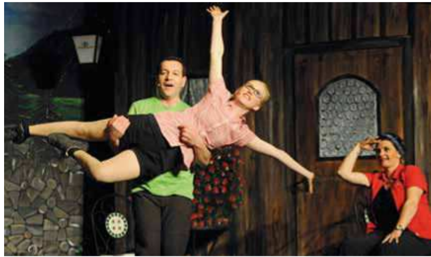
In «Stilli Zärtlichkeit» fliegt man dem Glück entgegen.