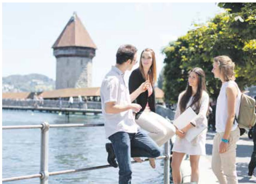
Studieren Sie in Luzern: Die Ausbildungsräume der PH Luzern befinden sich mitten in der Stadt.

Würden Sie gerne unterrichten, haben aber keine gymnasiale Matura? Die PH Luzern bietet für Quereinsteigende ein spezielles Aufnahmeverfahren an. Wenn Sie über 30 Jahre alt sind, einen Lehrabschluss und Berufserfahrung vorweisen können, dürfen Sie am Aufnahmeverfahren «sur dossier» teilnehmen. Dieses besteht aus einem einzureichenden Dossier und einem halbtägigen Assessment. Mit dem Bestehen beider Teile erhalten Sie die Zugangsberechtigung zum Vollzeitstudium Kindergarten/Unterstufe, Primarstufe oder Sekundarstufe I an der PH Luzern. Für Personen, die noch nicht 30 Jahre alt sind und nicht