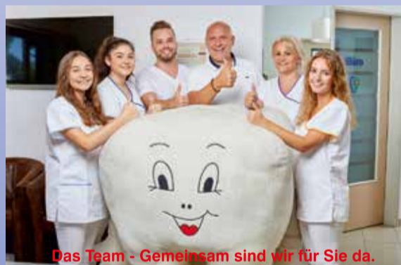
Das Team - Gemeinsam sind wir für Sie da.