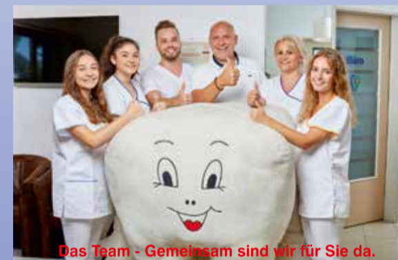
Das Team - Gemeinsam sind wir für Sie da.