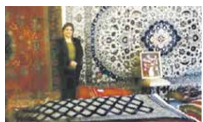
Telefon +41 76 785 35 84 Farzaneh Teppich Gallery Bernstrasse 107 4852 Rothrist

Das Angebot umfasst Perserteppiche in allen Mustern, Massen und Preislagen, von strapazierfähigen Qualitäten wie Bidjar bis zu seinen Meisterwerken aus Ghom oder Kaschmir, von trendigen Knüpfungen wie beispielsweise Ziegler bis zu zeitlosen Klassikern wie Täbriz, Nain, Keschan, alte Kazak und Sumakh-Kelim, von modernen Unikaten für junges Wohnen, z. B. Gabbeh, bis zu alten, antiken Raritäten von bleibendem Wert wie Antik-Sarough.