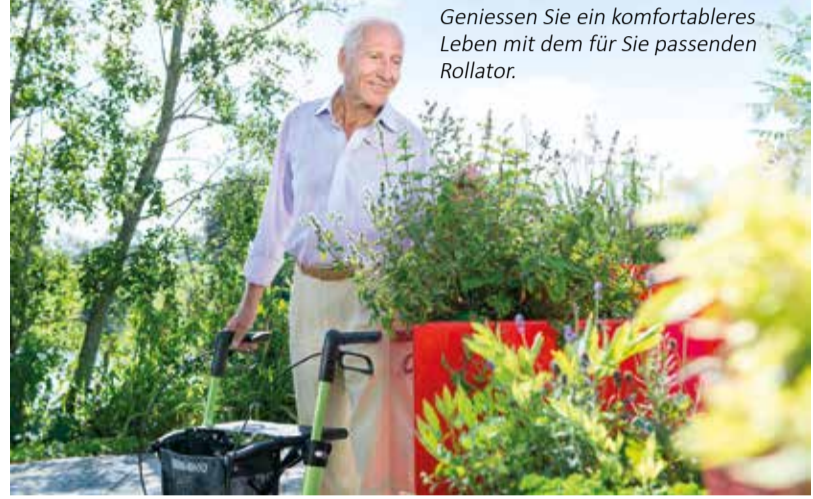
Geniessen Sie ein komfortableres Leben mit dem für Sie passenden Rollator.

Wir sind gerne für Sie da! Im Hilfsmittel-Markt Niederbipp finden Sie eine grosse Auswahl an Hilfsmitteln für mehr Lebensqualität: • Rollatoren • Rollstühle und Scooter • Betten und Matratzen • Aufsteh- und Ruhesessel • Notrufsysteme • ... und vieles mehr! Unsere kompetenten Mitarbeiterinnen und Mitarbeiter sind gerne für Sie da und freuen sich, Sie persönlich zu beraten. Ebenfalls bieten wir die Wartung und Reparatur von Hilfsmitteln an.