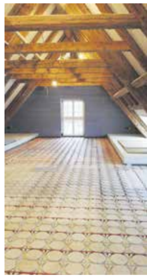
VS REI 100709