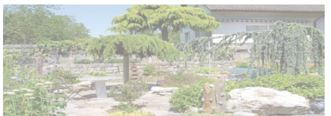
VS AVE 100729

Werkstrasse 8, 3250 Lyss Tel. 031 879 06 68 info@gartenpartner.ch www.gartenpartner.ch