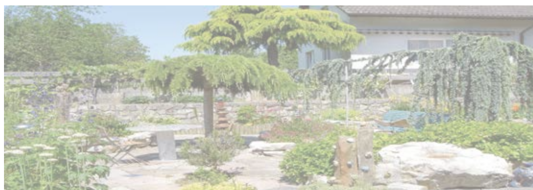
VS AVE 100729

Werkstrasse 8, 3250 Lyss Tel. 031 879 06 68 info@gartenpartner.ch www.gartenpartner.ch