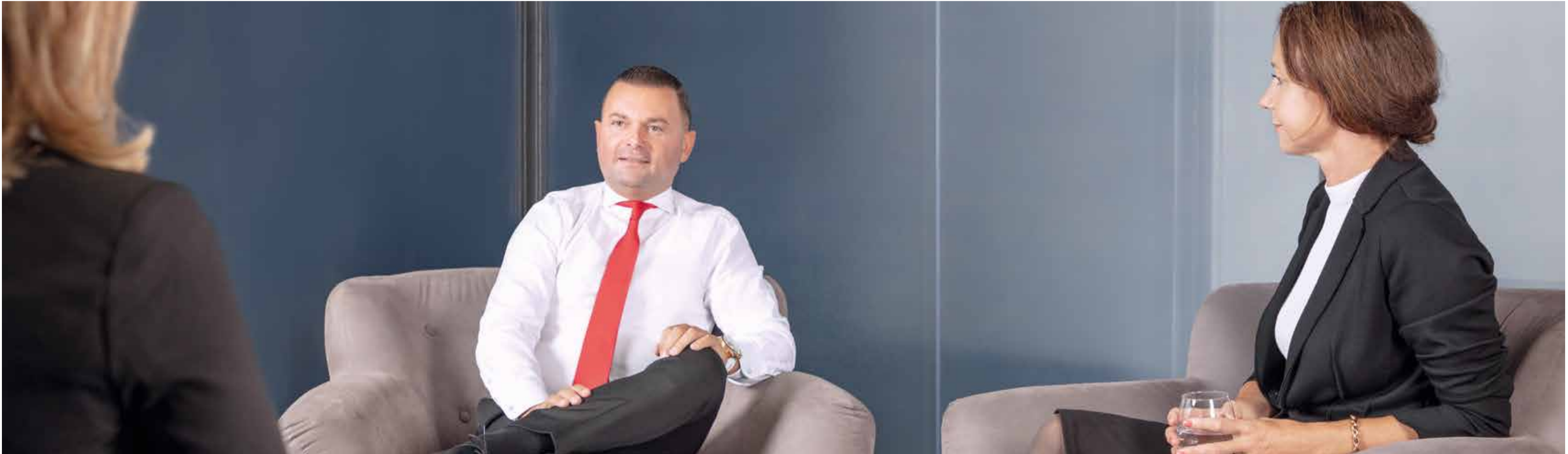
Mit vielfältigen Dienstleistungen und optimalen Prozessen hat sich die Immobilien Börse zu einer führenden Anbieterin in der Branche entwickelt. Versierte Immobilienexperten unterstützen erfolgreich beim Liegenschafts Kauf und -verkauf und setzen auf persönliche Beratung und digitale Präsentation.

Immobilien Börse – Seit dem Jahr 2013 führt der zuverlässige, kompetente Immobiliendienstleister in Sachen Liegenschaftstransaktionen seine Kundschaft zum erfolgreichen Liegenschaftsverkauf. Dazu bildet das Unternehmen laufend angehende und erfahrene Immobilienexpertinnen und -experten aus und weiter und sorgt so für einen hohen Qualitätsstandard in der Immobilienbranche.