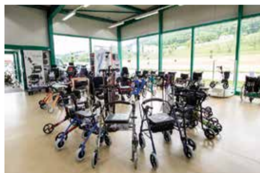
Im Hilfsmittel-Markt in Niederbipp finden Sie eine grosse Auswahl an verschiedenen Hilfsmitteln, die Sie für einen kurzen oder langen Zeitraum mieten können.

Im Hilfsmittel-Markt Niederbipp finden Sie verschiedene Hilfsmittel für einen komfortableren Alltag: • Betten und Matratzen • Aufsteh- und Ruhesessel • Notrufsysteme • Rollatoren, Scooter und (elektrische) Rollstühle • Und viele weitere kleine Alltagshelfer Unsere kompetenten Mitarbeiterinnen und Mitarbeiter sind gerne für Sie da und freuen sich, Sie persönlich zu beraten. Ebenfalls bieten wir die Wartung und Reparatur von Hilfsmitteln an.