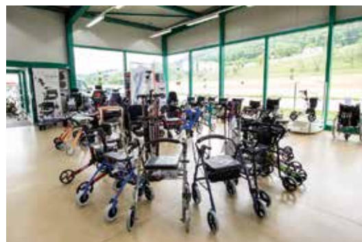
Im Hilfsmittel-Markt in Niederbipp finden Sie eine grosse Auswahl an verschiedenen Hilfsmitteln, die Sie für einen kurzen oder langen Zeitraum mieten können.

Spitalausritt bei uns angerufen. Als der Mann am nächsten Tag nach Hause kam, hatte unser Serviceteam in seinem Zuhause bereits alles eingerichtet.