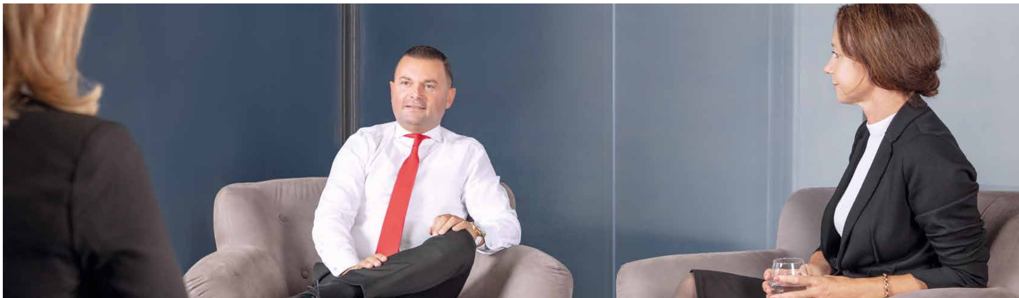
Mit vielfältigen Dienstleistungen und optimalen Prozessen hat sich die Immobilien Börse zu einer führenden Anbieterin in der Branche entwickelt. Versierte Immobilienexperten unterstützen erfolgreich beim Liegenschafts Kauf und -verkauf und setzen auf persönliche Beratung und digitale Präsentation.

Immobilien Börse – Seit dem Jahr 2013 führt der zuverlässige, kompetente Immobiliendienstleister in Sachen Liegenschaftstransaktionen seine Kundschaft zum erfolgreichen Liegenschaftsverkauf. Dazu bildet das Unternehmen laufend angehende und erfahrene Immobilienexpertinnen und -experten aus und weiter und sorgt so für einen hohen Qualitätsstandard in der Immobilienbranche.