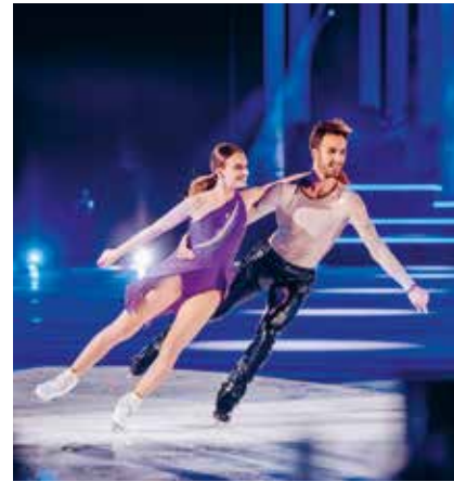
Schon bald bei Art on Ice zu sehen: Die amtierenden Eistanz-Olympiasieger Gabriella Papadakis und Guillaume Cizeron