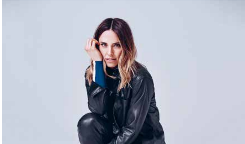
Melanie C wird neben Rag'n'Bone Man, Gjon's Tears und Elle für musikalische Highlights sorgen.